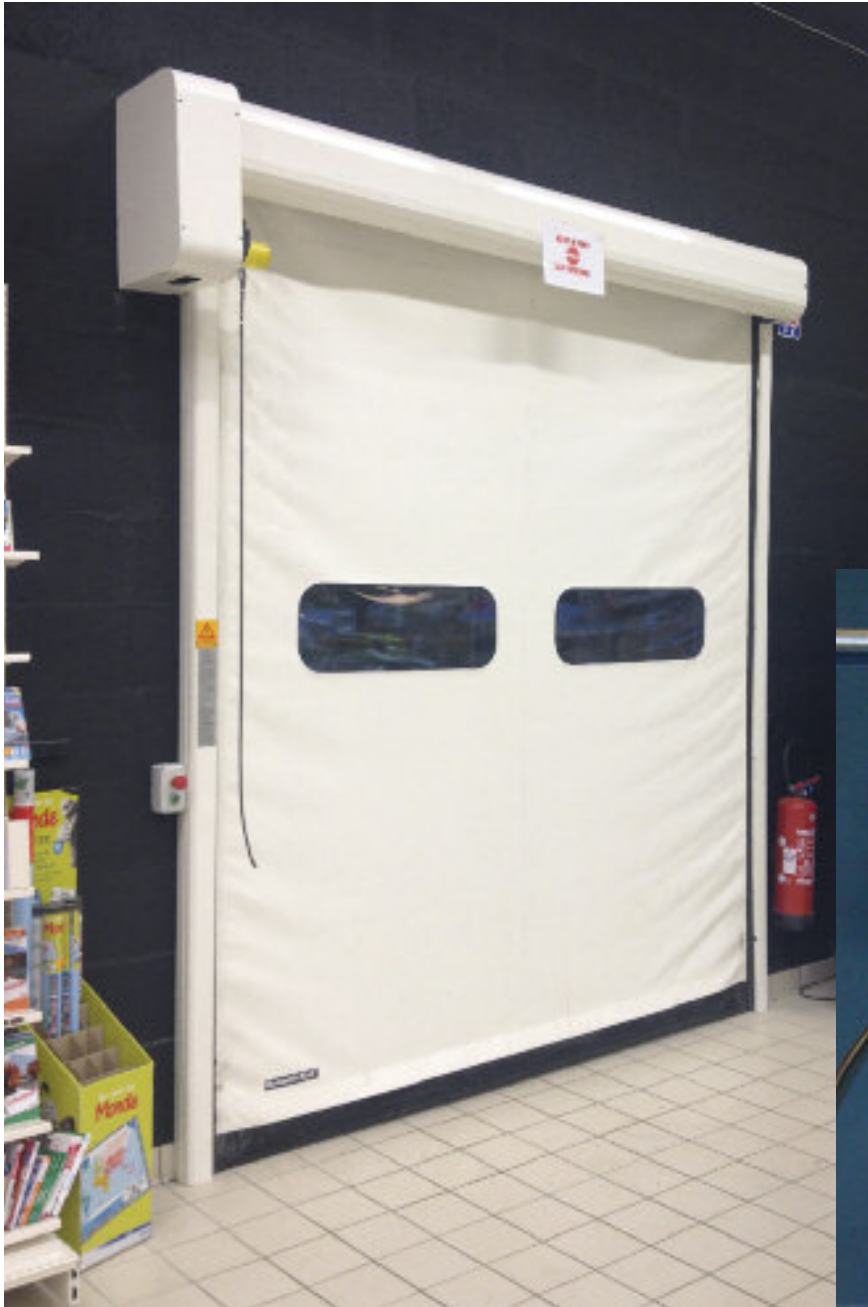
porte souple : option capot traverse et capot moteur